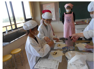
おかし作り (地区食改)