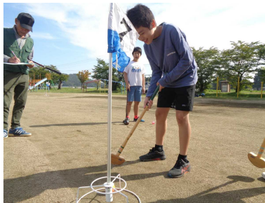
グラウンドゴルフ (地区協会)