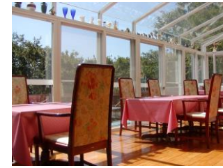
四季を楽しめる食堂