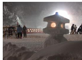
ライターゆきぼんぼり風景