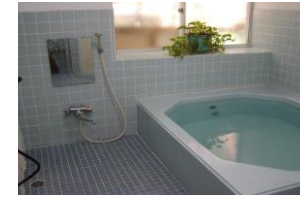
24 時間清潔なお風呂 4~5 人収容