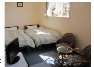
ツインルーム風景