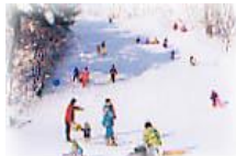
チビツ子グレンデ風景

初心者からベテランまで十分満足頂ける 公式競技バーンを有するスキー場「グレンデ」