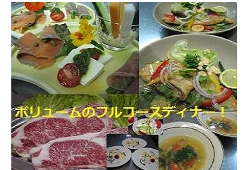
好評のフルコースディナー