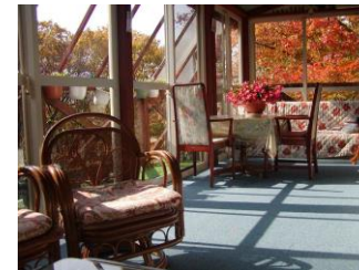
ゆったりスペース約 10 畳モーニングルーム