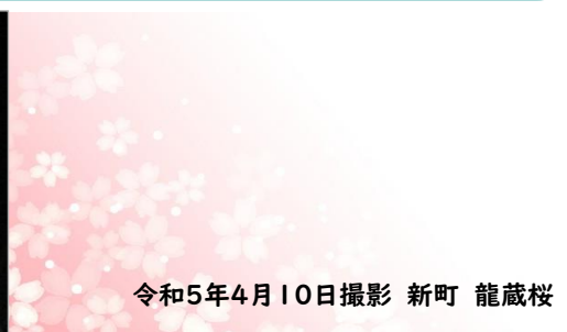
令和5年4月10日撮影 新町 龍蔵桜