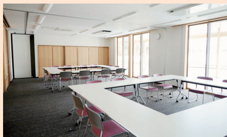
第1・第2研修室 (40.58㎡・34.78㎡) (仕切りを使って分割して使えます)